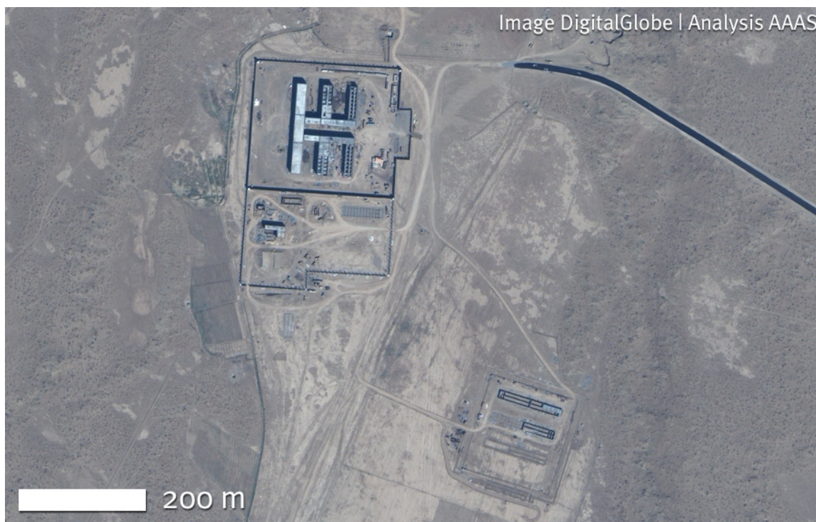
Снимок 2. Овадан Депе в стадии строительства в 2002 г.