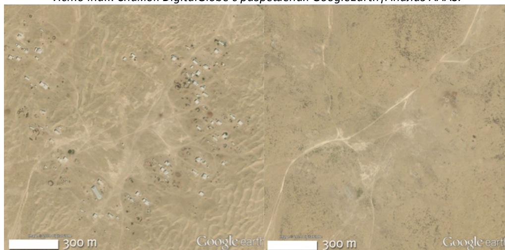
Снимок 6. Изображенная на снимке 2002 года (слева) деревня пропала на снимке 2010 года (справа).