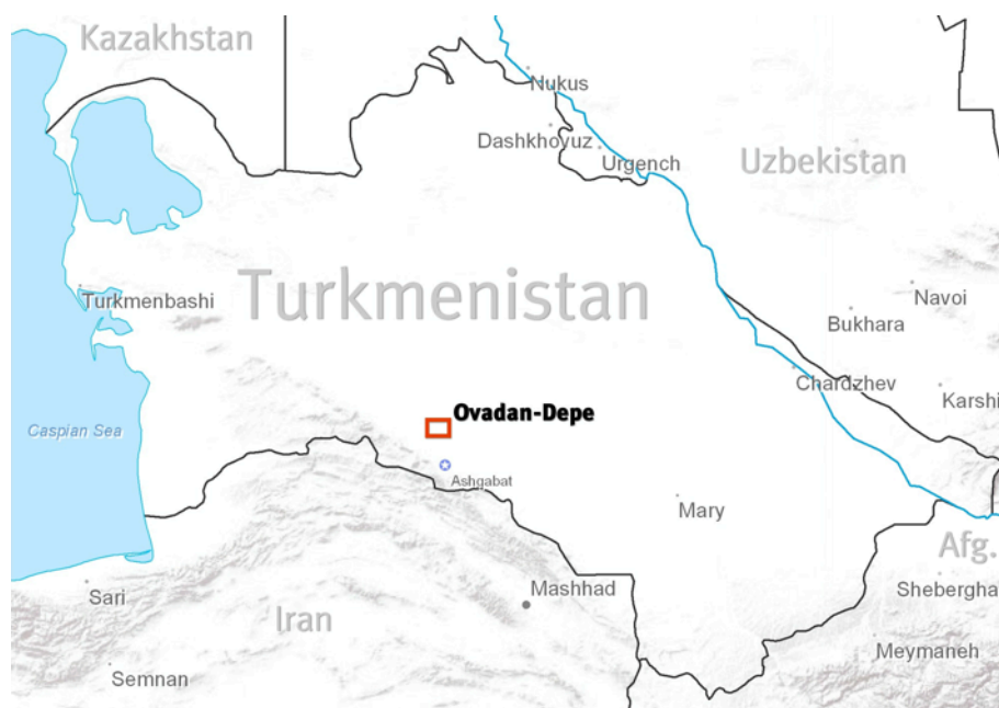
Снимок 1. Местонахождение тюрьмы Овадан Деде.

Тюрьма Овадан Деде является современным символом средневековых пыток и полным презрением к правам человека. Она находится в Туркменистане, стране, богатой природным газом, но имеющей одну из худших репутаций в мире в области прав человека. Неизменно причисляемый различными международными организациями к таким странам, как Северная Корея и Бирма, Туркменистан изолирован, управляется страной авторитарным лидером, создавшим отвратительный культ личности, а его правительство не терпит независимого мышления, не говоря уже о политической оппозиции. 3 Тюрьма Овадан Деде не только предназначена для содержания заключенных, но специально спроектирована так, чтобы неизлечимо подорвать физическое и психическое состояния содержащихся в ней политзаключенных. Овадан Деде, по иронии судьбы означающий на туркменском языке «живописный холм», является, возможно, одним из худших мест на свете. Мало что известно об этой тюрьме, поскольку правительство Туркменистана отказывается обнародовать любую информацию о ее структуре или состоянии пребывающих в ней узников. Международным наблюдателям, в том числе Международной федерации обществ Красного Креста и Красного Полумесяца, ни разу не дали возможности посетить эту тюрьму.