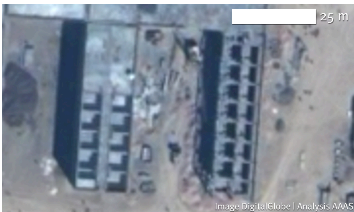
Снимок 2. Крупный план камер (ячеек), обнаруженных благодаря частичному покрытию крыши.

Снимки 2009 года показывают, что строительство тюрьмы к этому времени было в основном завершено. Видна траншея по наружному периметру и контрольно-пропускной пункт с подъездной дорогой, двустенное ограждение по внутреннему периметру, сторожевые вышки вокруг самих тюремных сооружений, а также потенциальное административное здание и казармы для охраны и обслуживающего персонала. Только некоторые из предполагаемых камер, выявленных на снимках 2002 года, были уже покрыты крышей на снимках 2009 года, причем большинство из них оставались непокрытыми, вероятно, предназначаясь для «прогулок»