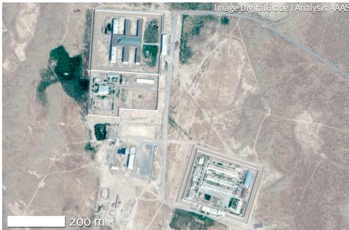
Снимок 3. Завершенный тюремный комплекс в 2009 г.

заключенных «на свежем воздухе». Камеры в восточном крыле подразделяются, в свою очередь, на более мелкие двух разных размеров: 3 x 3 метров и 6 x 3 метров. Также видно, что здание тюрьмы имеет три этажа. Отсутствуют признаки какого-либо повреждения или возможного сноса тюремного комплекса после смерти президента Ниязова в декабре 2006 года.