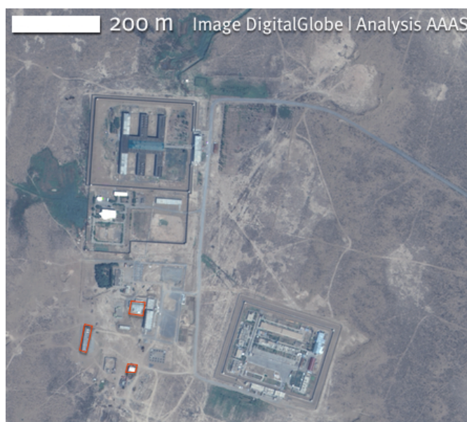
Снимок 5. Изображение 2010 года, показывающее дальнейшее расширение Овадан Депе (выделено красным)

или добровольным, и при каких условиях? На эти вопросы могут ответить только власти Туркменистана.