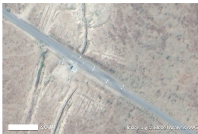
Снимок 4. КПП на внешнем периметре и заграждения на подъездной дороге, 2009 год.

Снимок 2010 года показывает, что тюремный комплекс продолжает расширяться за пределы периметра максимальной безопасности тюрьмы. Возможно, это были дополнительные постройки для вспомогательного персонала и охранников. Такое продолжающееся расширение комплекса означает, что тюрьма Овадан Депа является очень активной действующей и важной частью пенитенциарной системы Туркменистана, и что правительство продолжает вкладывать в нее средства. Проведенный AAAS анализ снимков также указывает на то, что деревня, расположенная в 5 км к северо-западу от Овадан Депа и насчитывавшая в 2002 году 107 хозяйств, была полностью покинута людьми в 2010 году. Во время президентства Ниязова ходили слухи о принудительном переселении деревни. Что произошло с этой деревней, было ли перемещение принудительным